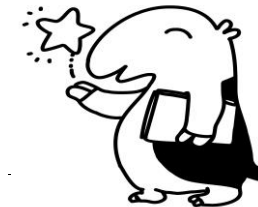
イメージキャラクター「あおばくん」